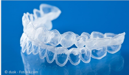
Bleaching-Form aus Kunststoff, in die Sie das Aufhellungs-Gel einfüllen.

Beim Home-Bleaching werden vom Zahnarzt dünne flexible Formen aus einem transparenten Kunststoff hergestellt, die genau auf Ihre Zähne passen (siehe Foto).