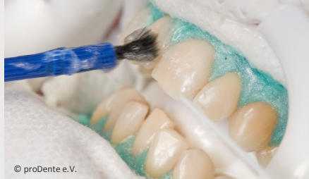
Power-Bleaching beim Zahnarzt: Auftragen des Bleaching-Gels

Wenn Sie die Praxis wieder verlassen, können Sie sich an sichtbar helleren Zähnen freuen!