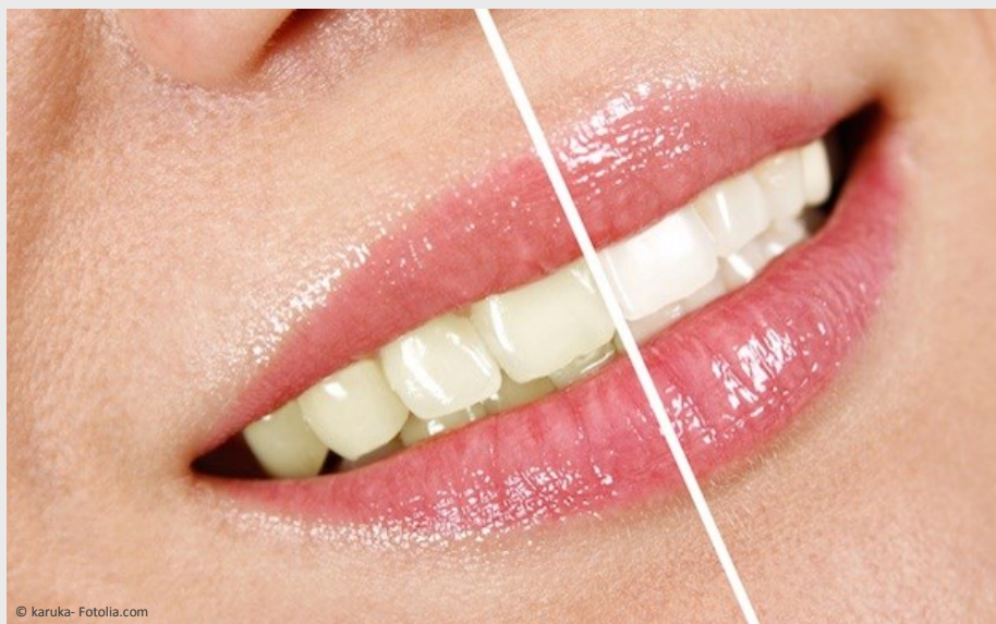
Deutlicher Unterschied: Professionelles Bleaching beim Zahnarzt wirkt!

Vertrauen Sie Ihre Zähne besser Profis an!