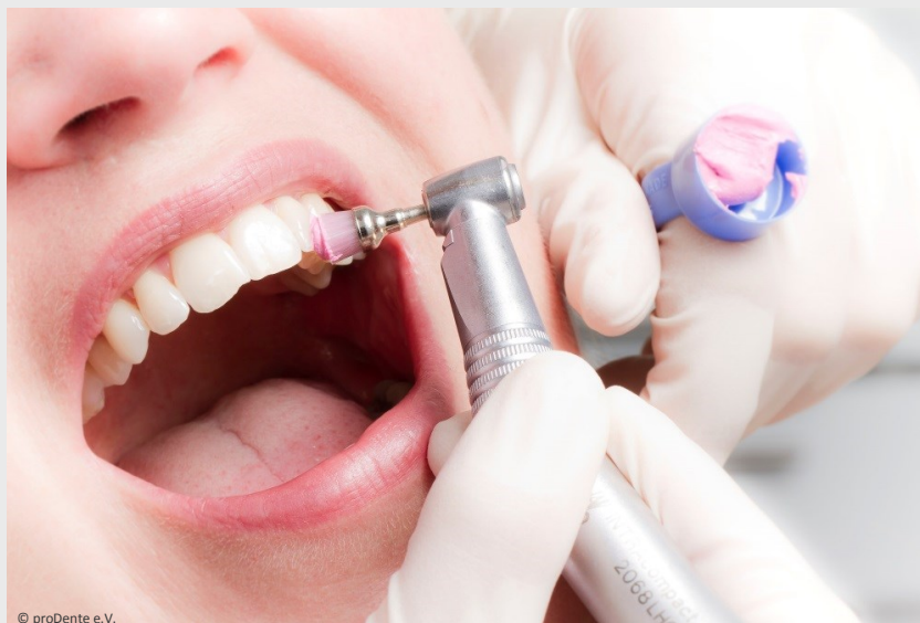
Die Professionelle Zahnreinigung wird von speziell ausgebildeten Prophylaxe-Fachkräften ausgeführt und ist eine lohnende Investition in die eigene Gesundheit.

Vertrauen Sie Ihre Zahngesundheit Profis an!