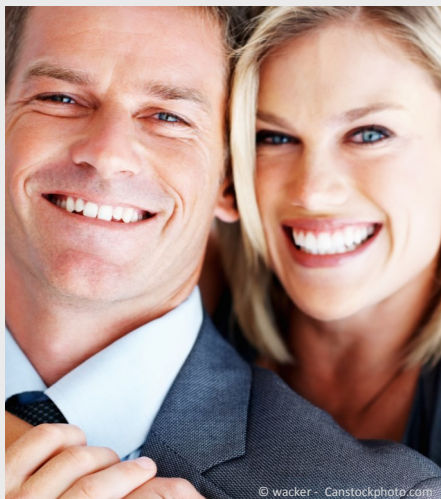
Selbstsicher mit gepflegten Zähnen

Dann werden Mund, Zähne und Zahnfleisch untersucht. Die Zahnbeläge werden angefärbt, um sie besser sichtbar zu machen und es wird die Tiefe der Zahnfleischtaschen gemessen.